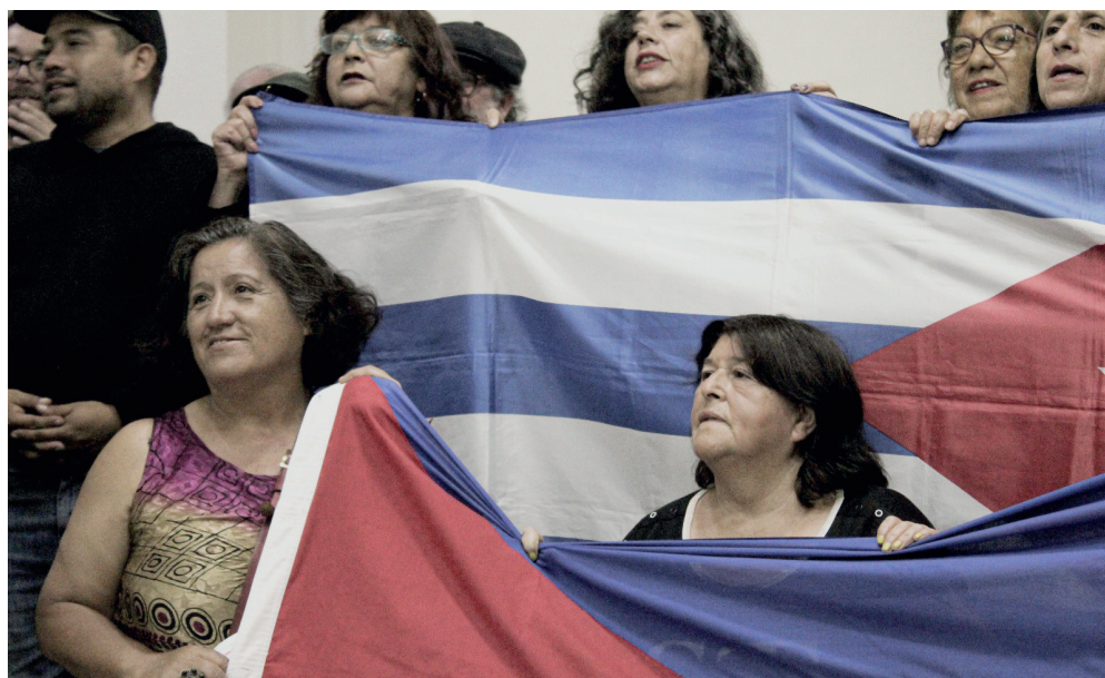
Cuba genera esas cosas, dentro y fuera de ella, que así, como un arranque, se le quiere mucho.

Antes de que alguien hable pondrán un documental de La Jornada, realizado bajo los fueros de este mismo febrero. Y el video empieza con la voz de una mujer de 22 años. No me es desconocida. «Obviamente no