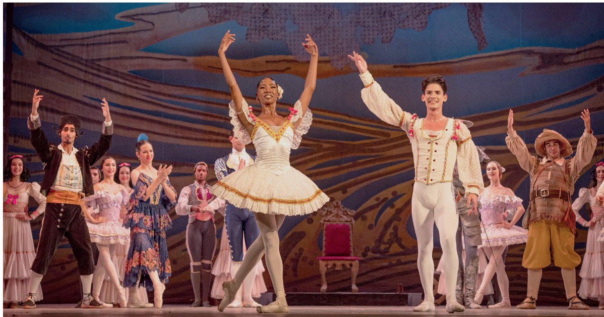
Público en pie...