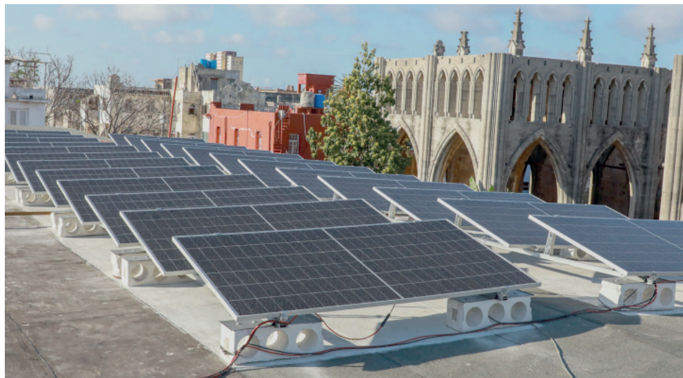
El policlínico Abelardo Ramírez Márquez, en La Habana, fue una de las instituciones beneficiadas con este programa.

Destacó, además, el impacto social de esta medida: «Si usted les pone un sistema de 2 kW a estas personas allí, que pueden tener refrigerador, ventilador, televisor, ya la vida les cambia totalmente y entonces, contribuimos a evitar que esas personas emigren de sus localidades».