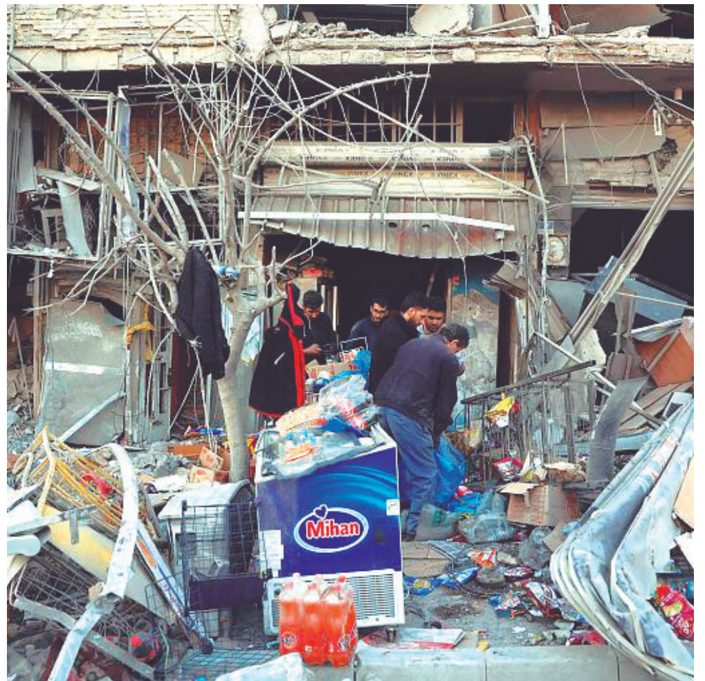
El ataque conjunto de Israel y EE. UU. contra Irán, es parte de un plan de dominio global que cuenta también con la maquinaria de la manipulación mediática.

Asesinar al líder religioso y espiritual iraní era un objetivo estratégico