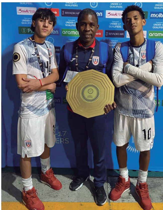
El director técnico ya había trabajado con algunos de los jugadores desde el proceso eliminatorio anterior.

Comparte que El Salvador poseía 16 integrantes en academias de Estados Unidos, Belice nueve y Curazao