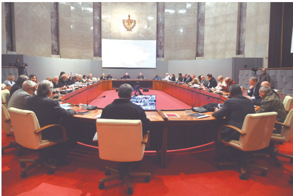
En la gestión autónoma y eficiente desde los municipios hay claves principales para afrontar las urgencias económicas actuales.

Nos tenemos que preparar, dijo, para que entre todos estemos